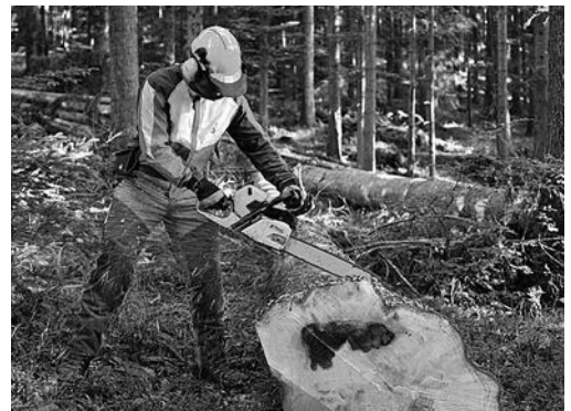
Bild 2: Arbeiten mit der Motorsäge gelten als gefährlich. Es muss eine zweite Person anwesend sein, die bei einem Unfall Hilfe leisten kann (Richtlinie 2134.d).

Die Fragen 2 bis 13 gelten für den Fall, dass Alleinarbeit erlaubt ist.