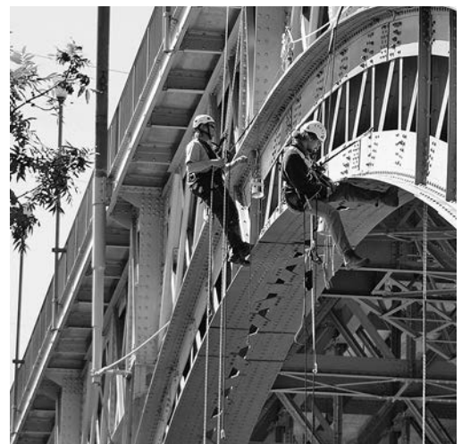
Bild 3: Arbeiten am hängenden Seil dürfen nur in Sichtverbindung und Rufweite einer zweiten Person ausgeführt werden (Bauarbeitenverordnung, Artikel 82).