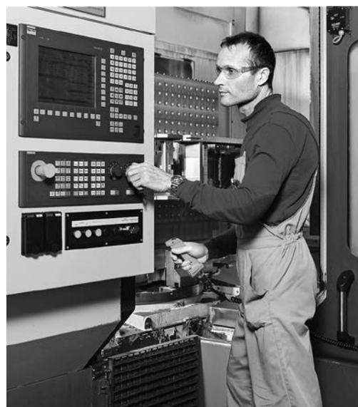
Bild 5: An diesem den Vorschriften entsprechenden Bearbeitungszentrum darf nur im Normalbetrieb allein gearbeitet werden. Für die Behebung von Störungen, für den Werkzeugwechsel und für Instandhaltungsarbeiten muss eine Sicht- und Rufverbindung zu einer zweiten Person bestehen.