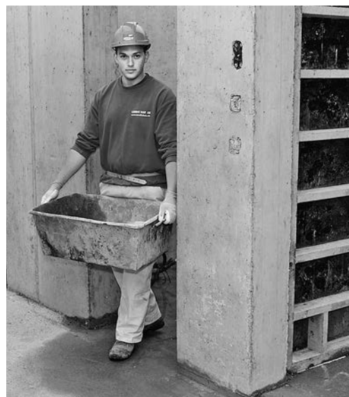
Bild 4: Diese Person darf alleine arbeiten. Der Vorgesetzte muss jedoch mittags und abends immer kontrollieren, dass dem Mitarbeitenden nichts passiert ist. Anhand der Beurteilungsmatrix im Merkblatt 44094.d wird die Tätigkeit im Feld 3b eingestuft: Periodische Überwachung (4h).